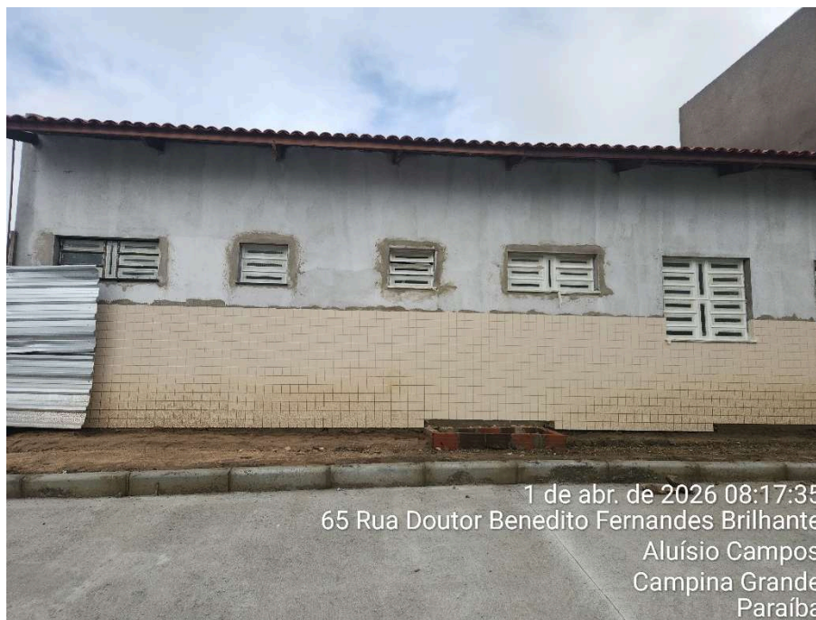
Fundo Selador em paredes