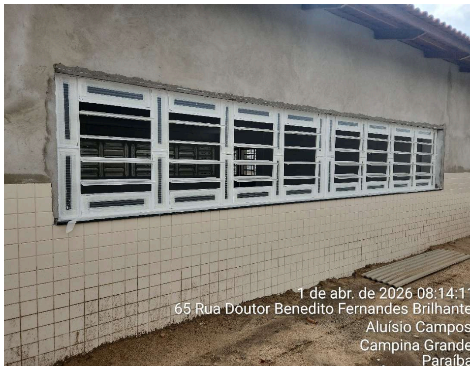
Instalação de vidros e pintura de esquadrias