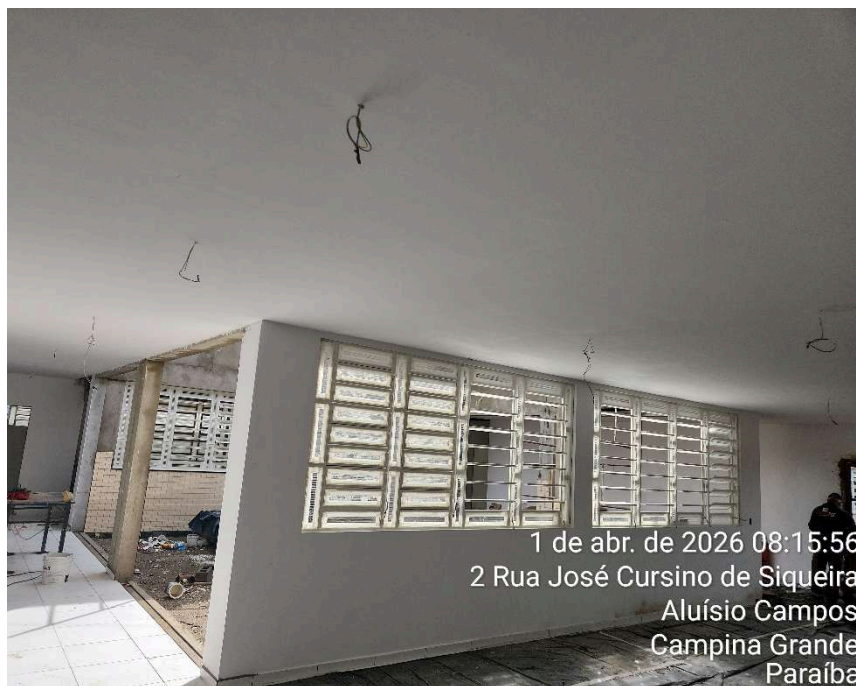
Emassamento de parede e teto